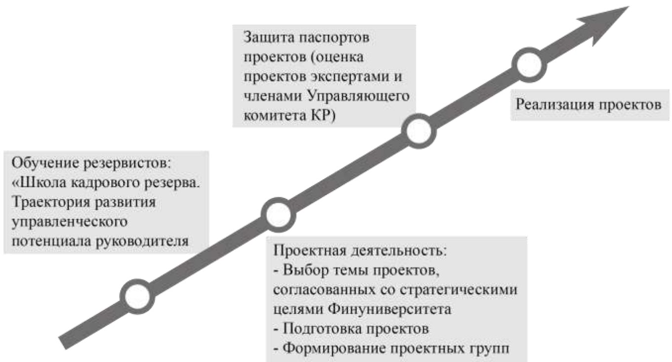
Рисунок 2. Основные мероприятия в рамках работы Кадрового резерва

самоподготовка работников, находящихся в резерве.