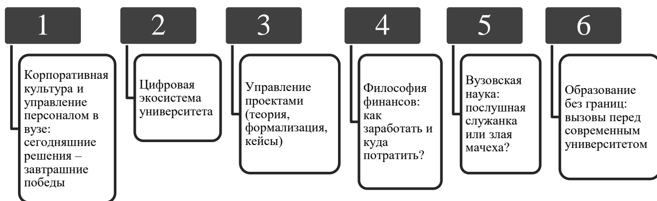
Рисунок 3. Программа «Школа кадрового резерва 2019 года»

Команда-победитель в проектной деятельности 2017 г. прошла международную стажировку в университете Антверпена. 7 работников из состава кадрового резерва в 2019 г. назначены на вышестоящие должности.