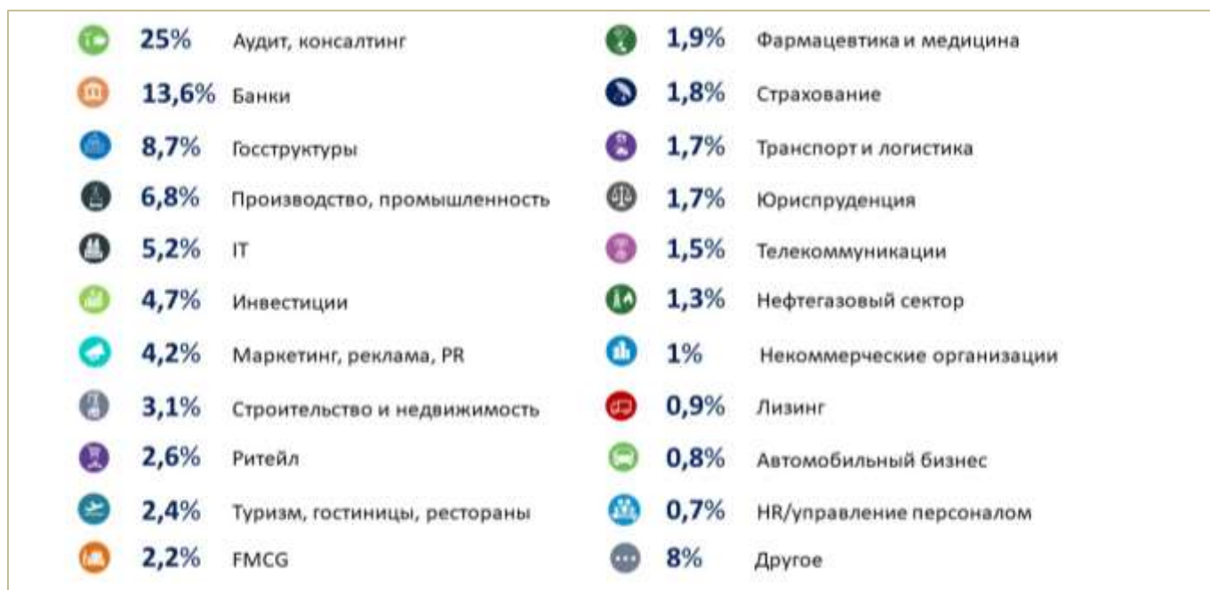
Рисунок 1. Сферы деятельности, в которых заняты выпускники Финансового университета

По результатам мониторинга эффективности деятельности образовательных организаций высшего образования Министерства науки и высшего образования Российской Федерации доля выпускников Финансового университета, трудоустроившихся в течение календарного года, следующего за годом выпуска, в общей численности выпускников, обучавшихся по основным образовательным программам высшего образования, составляет 80%. Расчет производился по данным Пенсионного фонда Российской Федерации.