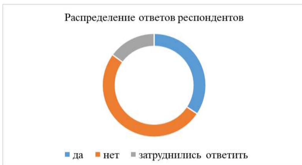
Рисунок 2. Готовность молодежи к ведению бизнеса.