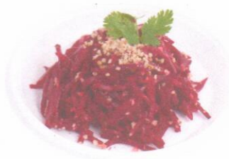
Салат «Столичный» Салат из свеклы с сыром