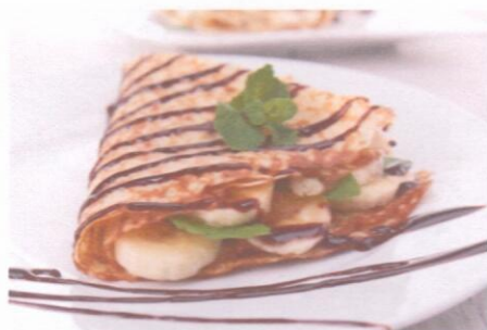
Блинчики со сгущенкой