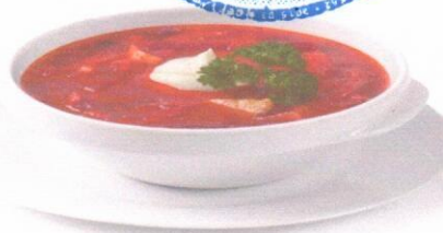
Борщ со сметаной