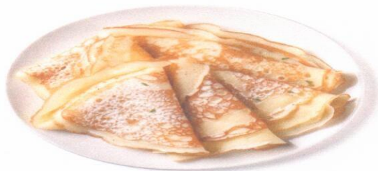
Блинчики со сметаной