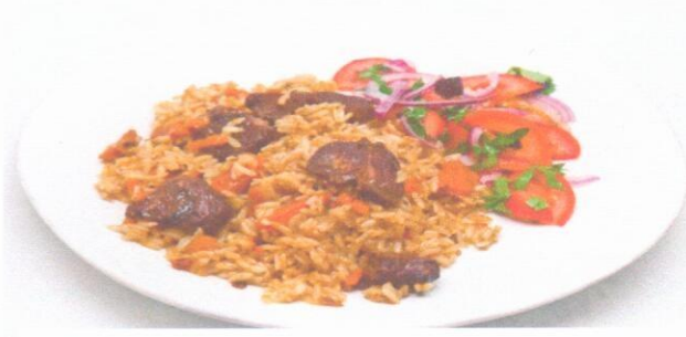
Плов с мясом (из птицы)