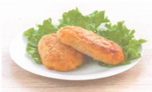
Котлеты рыбные (филе минтая) Картофельное пюре