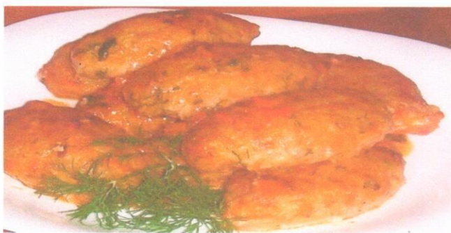
Голубцы ленивые с мясом