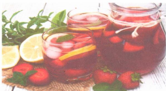
Чай с сахаром Компот из сухофруктов