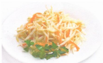
Салат «Витаминный» Салат мясной