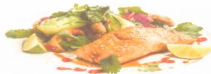
Рыба (филе минтая) запечённая с помидорами