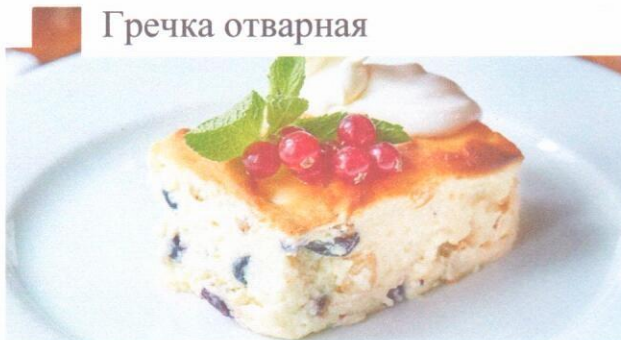
Гречка отварная Запеканка из творога