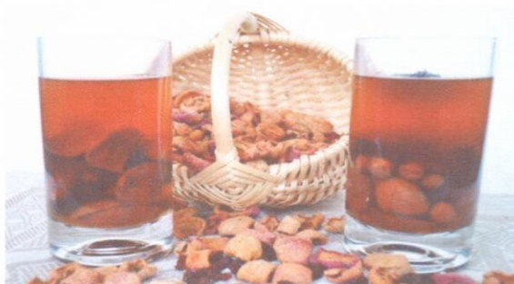
Чай с сахаром Компот из сухофруктов