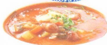
Рассольник со сметаной