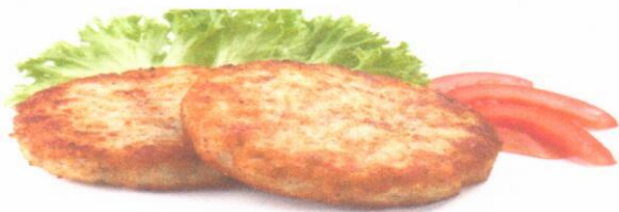
Котлеты из филе птицы