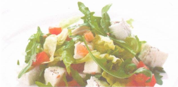
Салат «Летний» Салат из свеклы с сыром