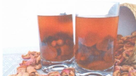
Чай с сахаром Компот из сухофруктов