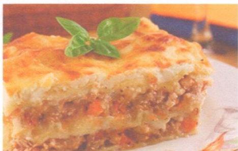
Запеканка картофельная с мясом