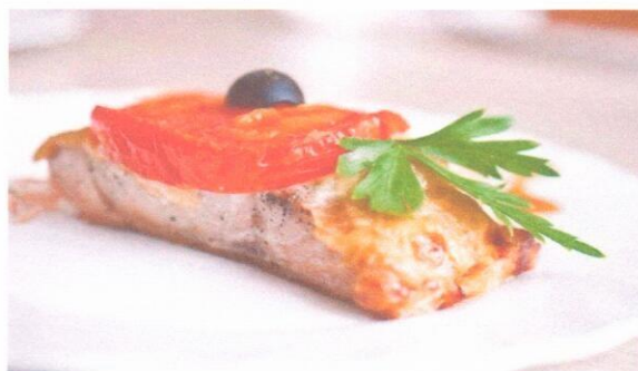
Рыба запечённая с помидорами