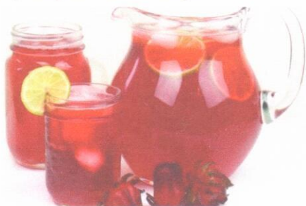
Чай с сахаром Компот из сухофруктов