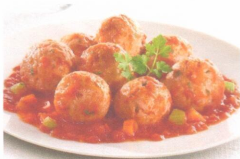
Тефтели из филе птицы