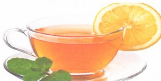
Чай с сахаром Компот из сухофруктов