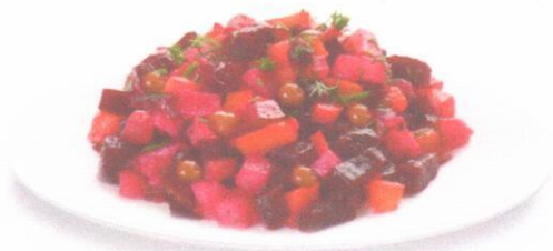
Салат «Весна» Винегрет