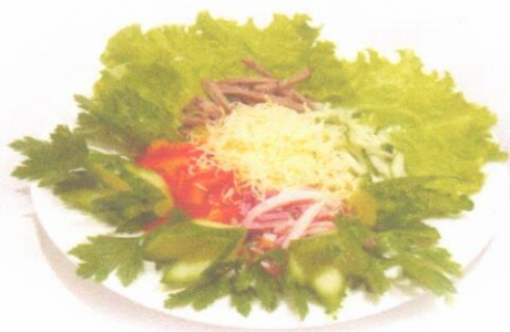
Салат из сырых овощей Салат «Столичный»