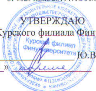
ГРАФИК учебного процесса для студентов 1 курса , обучающихся по основной образовательной программе – программе бакалавриата по очно-заочной форме обучения на 2019-2020 учебный год