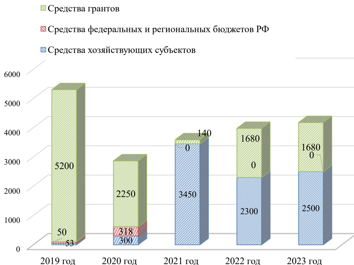
Рисунок 1. Структура доходов и источников финансирования НИР