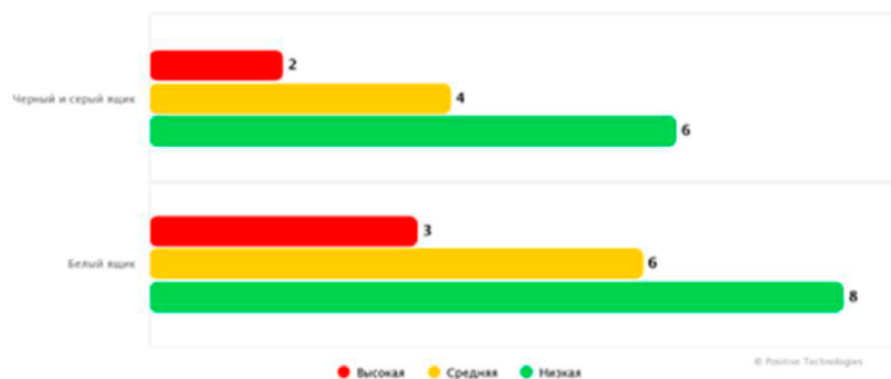
Рисунок 6 — Среднее число уязвимостей на одно приложение по методам тестирования

При наличии в работе таблицы ее наименование (краткое и точное) должно располагаться над таблицей без абзацного отступа в одну строку.