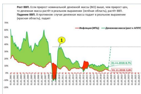
Рис. 1. Рост ВВП