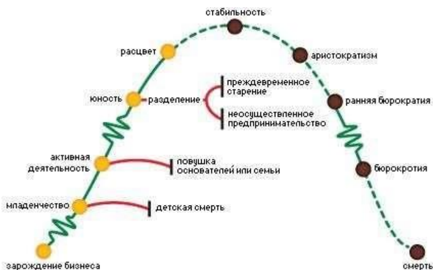
Рисунок 1. Жизненный цикл компании по И.Адизесу.

Может ли основатель бизнеса выполняющий функции владения и управления создать формализованные процессы управления?