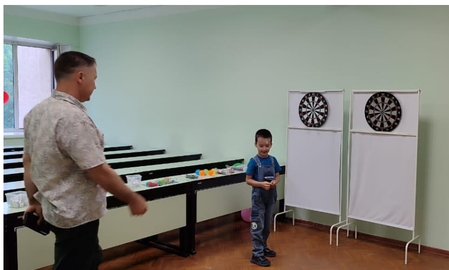
Интеллектуальная игра «Бизнес-дартс»