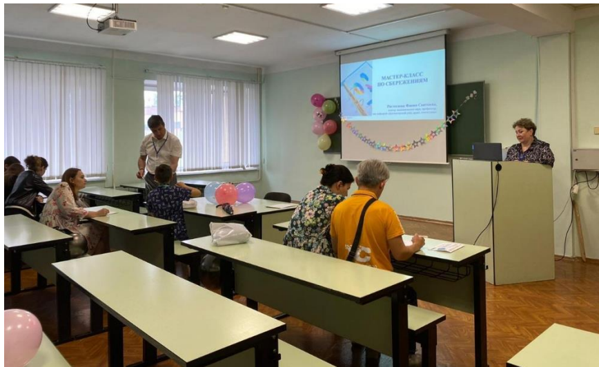
Мастер-класс по сбережениям