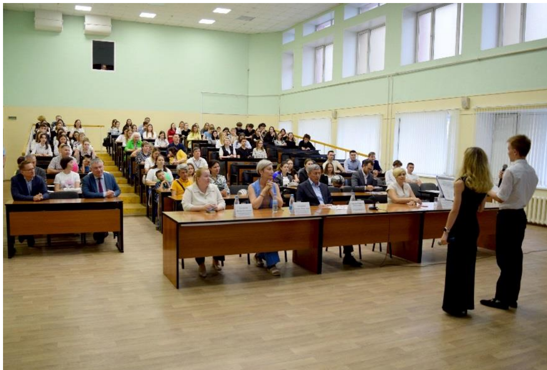
Торжественное открытие Фестиваля