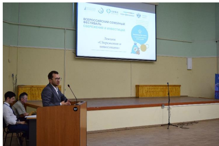
Лекция «Сбережения и инвестиции»