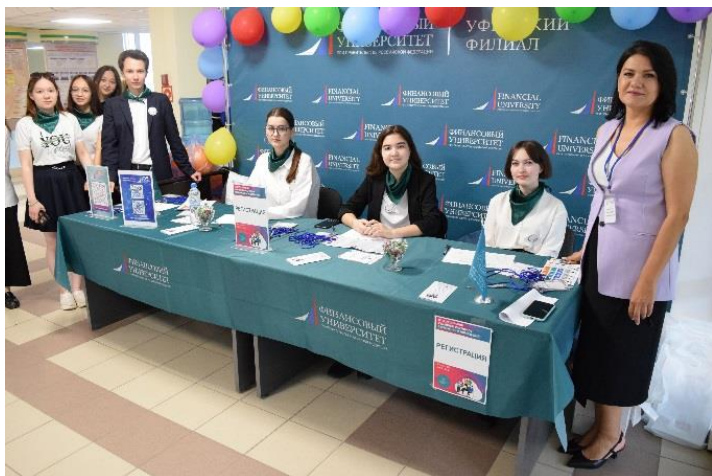
Зона регистрации участников Фестиваля