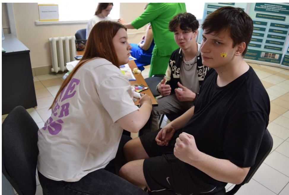
Сказочные рисунки в рамках участия в мастер-классе Аква-гим