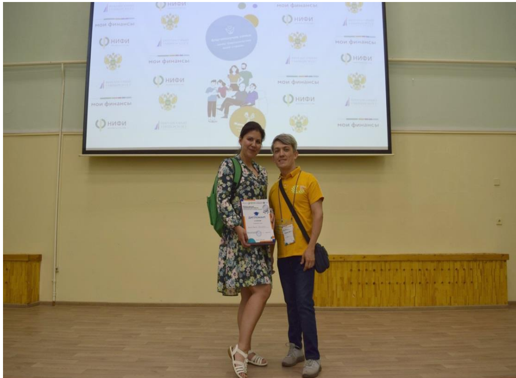
Дипломант 2 степени - семья Валеевых