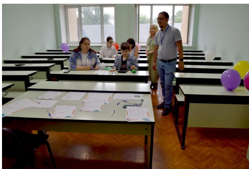
Интерактивная игра-симулятор «АКЦИОНЕР»