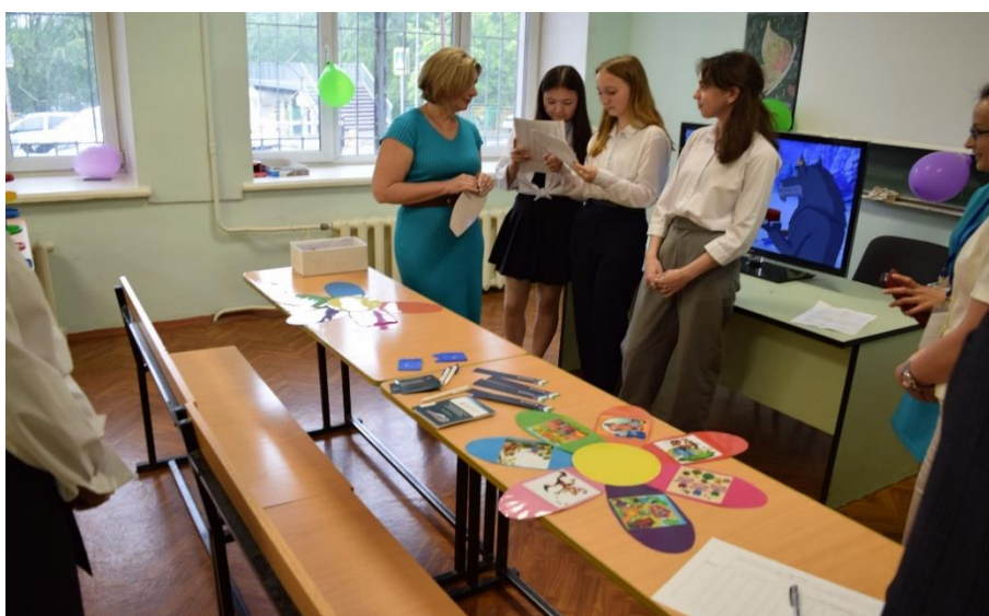
И.о. обязанности Министра финансов Республики Башкортостан посетила площадку по проведению интеллектуальной игры «Инвест-Ромашка»