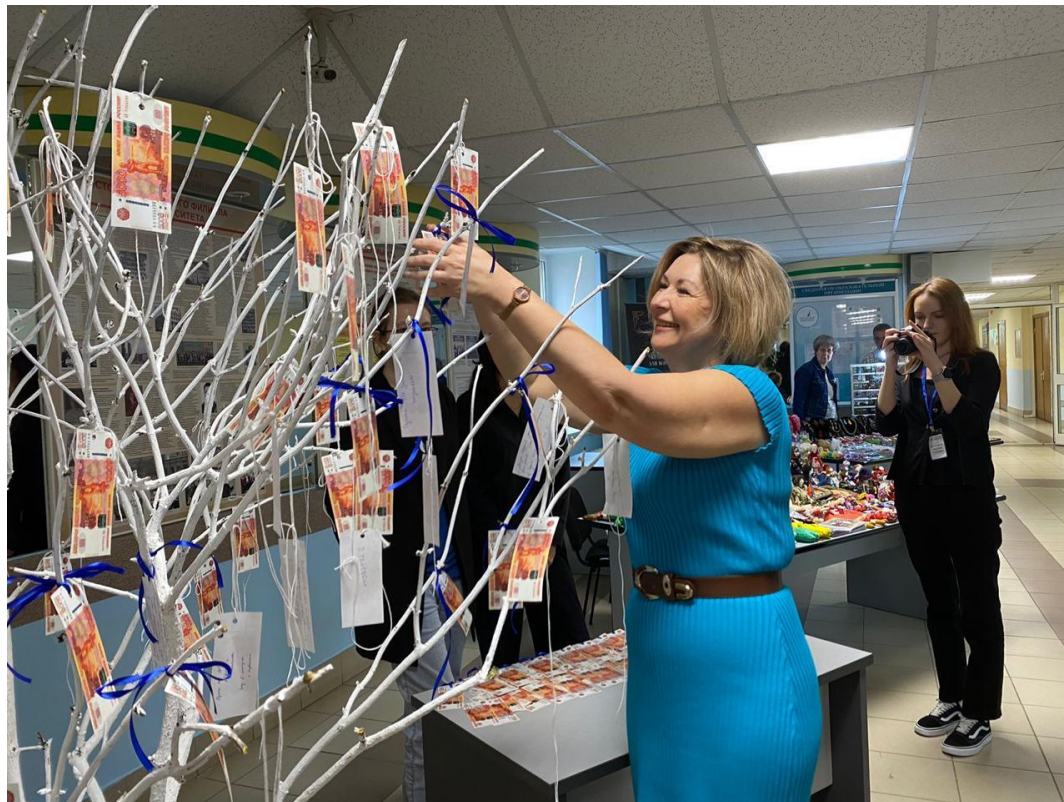
Пожелание от и.о. министра финансов Республики Башкортостан в адрес организаторов Фестиваля