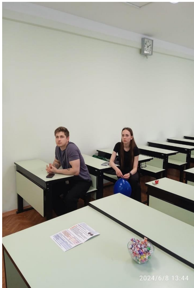
Викторина на тему: «Как поступить, чтобы защитить сбережения от инфляции»