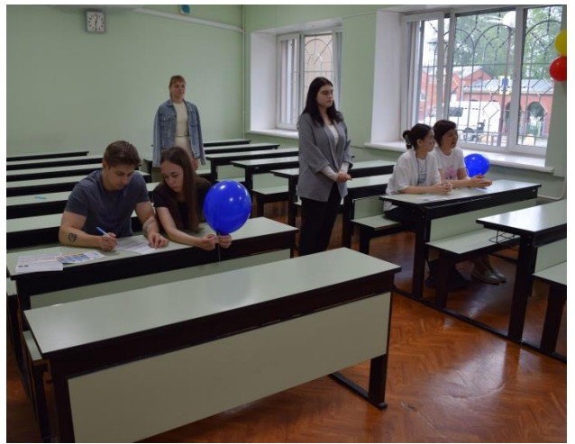
Квиз по сбережениям и инвестициям «Умная семья»