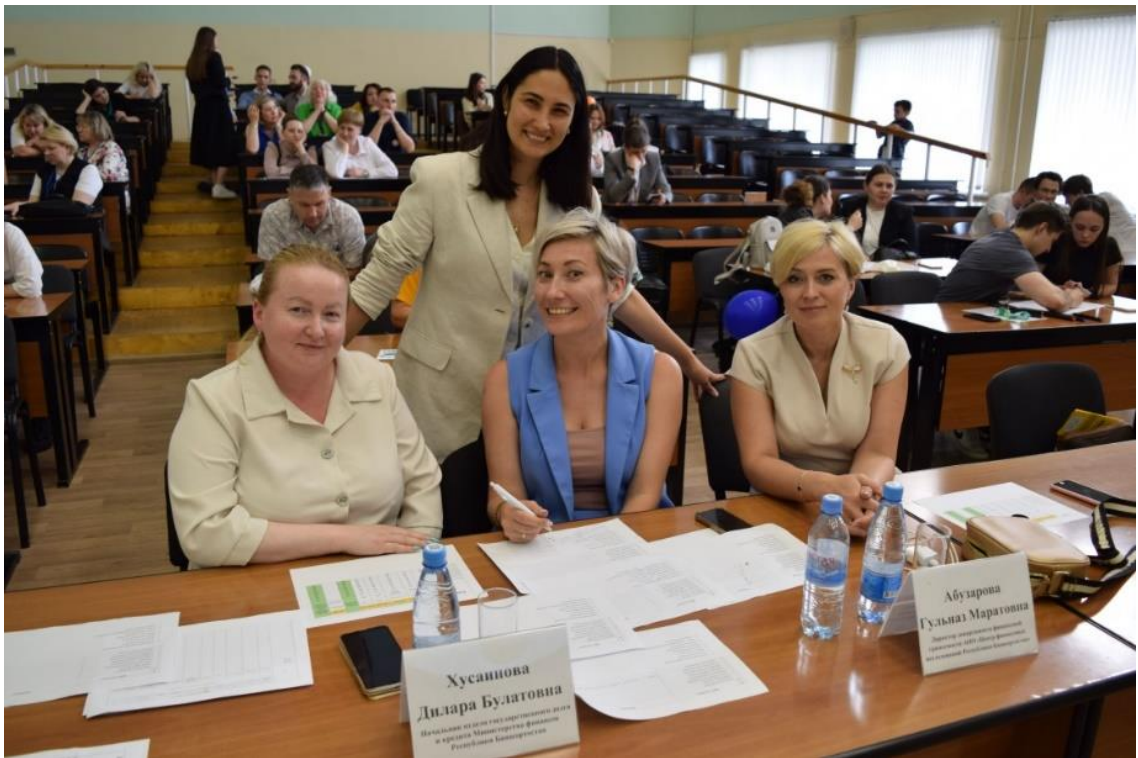
Работа членов жюри