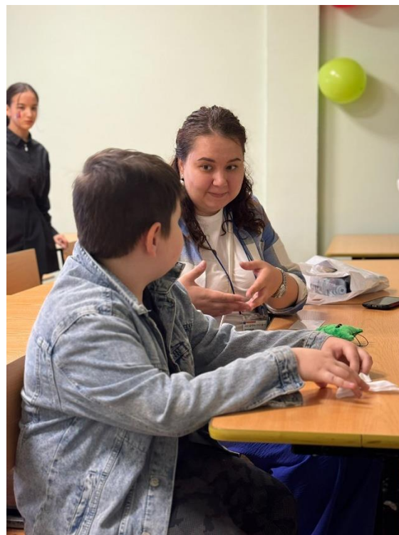
Квест на тему сбережений и инвестиций