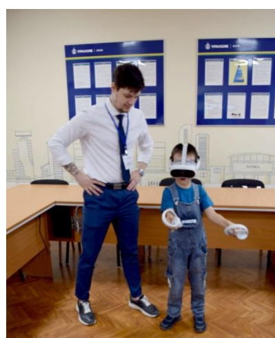
VR-турнир «Путь инвестора» был интересен от мала до велика