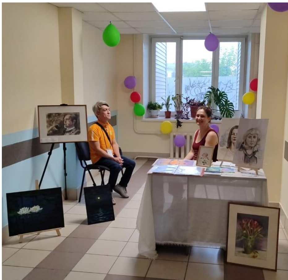
Мастер-класс «Портрет с натуры – как инвестиция в себя»