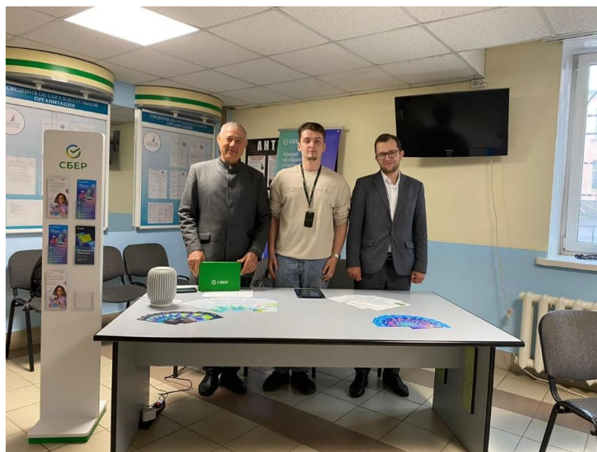
Информационно-консультационный стол по программе долгосрочных сбережений и партнерскому финансированию от Сбера