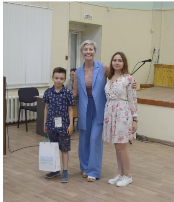
Награждение участников по номинациям