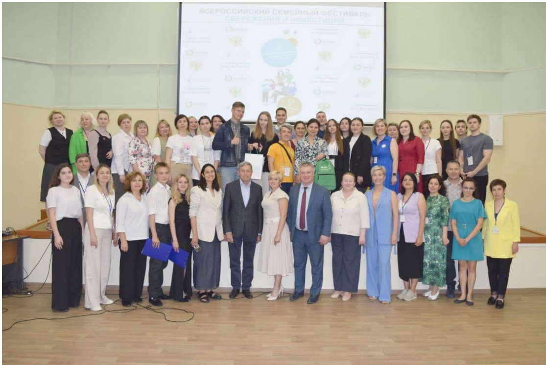
Торжественное подведение итогов и закрытие Фестиваля