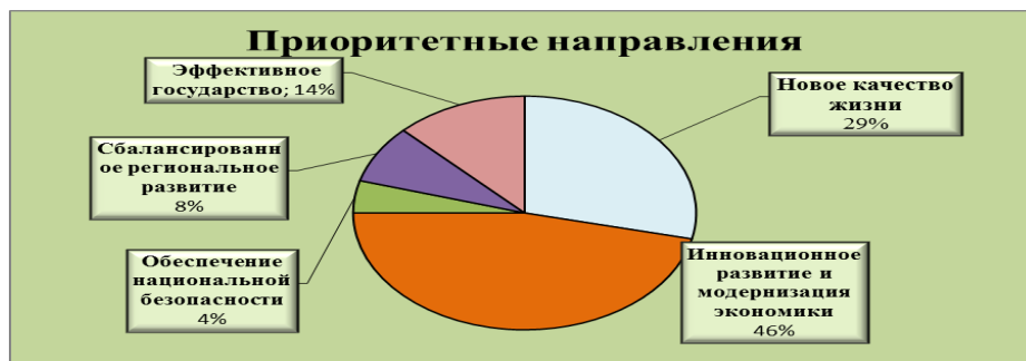
Рисунок 2.1. Ключевые блоки государственных программ