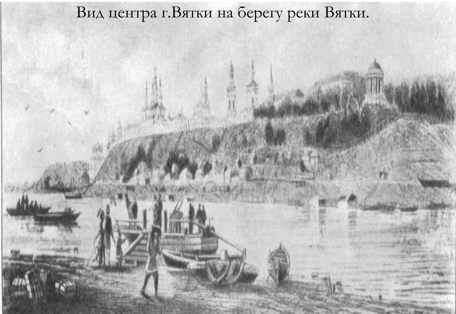
Вид центра г.Вятки на берегу реки Вятки.