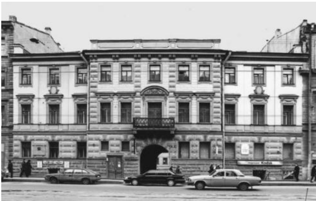
Дом, в котором жил и умер писатель М. Е. Салтыков-Щедрин в Петербурге

В феврале 1862 года Салтыков-Щедрин в первый раз вышел в отставку. Он хотел поселиться в Москве и основать там двухнедельный журнал; когда ему это не удалось, он переехал в Петербург и с начала 1863 года стал, фактически, одним из редакторов "Современника".