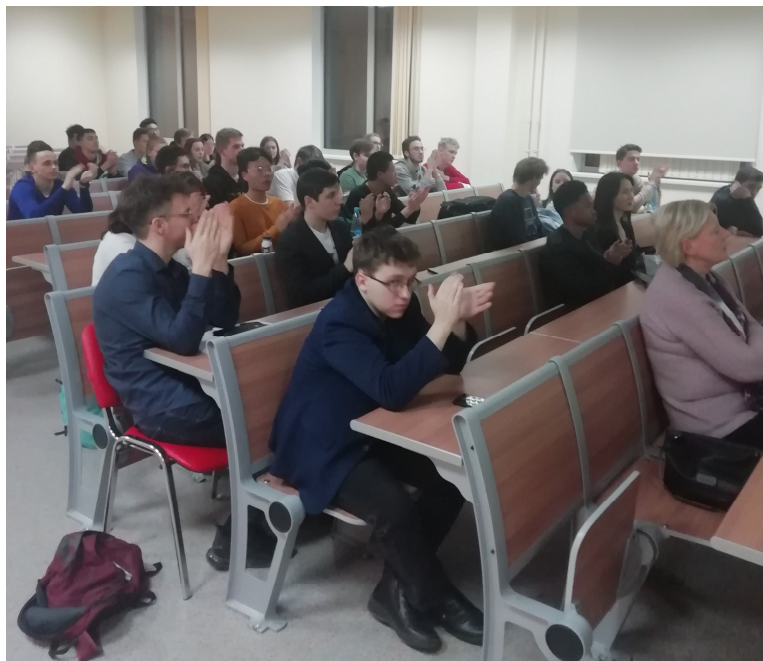
Аудитория благодарит членов Клуба за подготовленные сообщения (доклады).