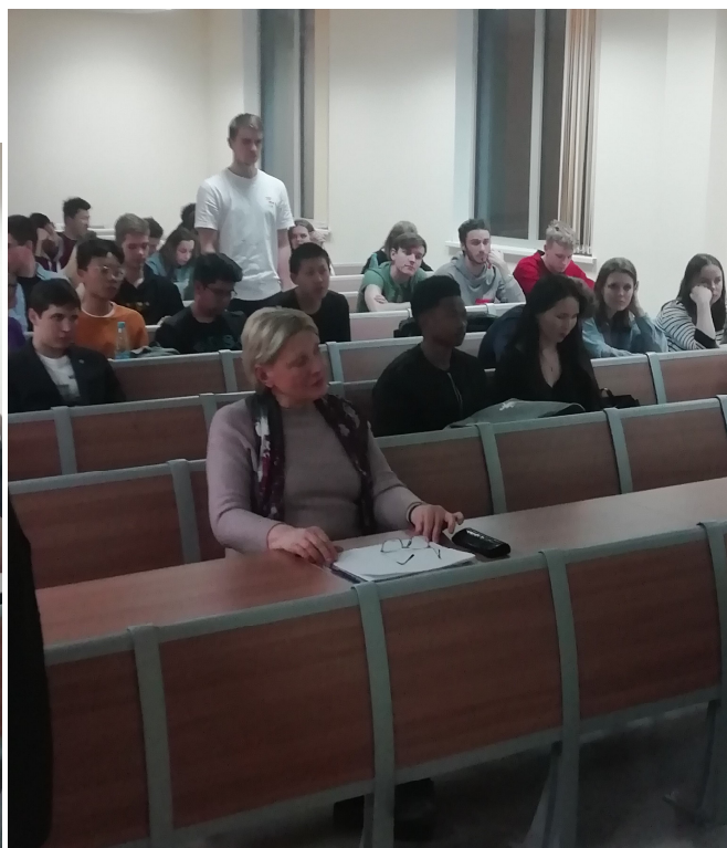
Члены Клуба активно задают вопросы профессору В.В. Дементьеву.