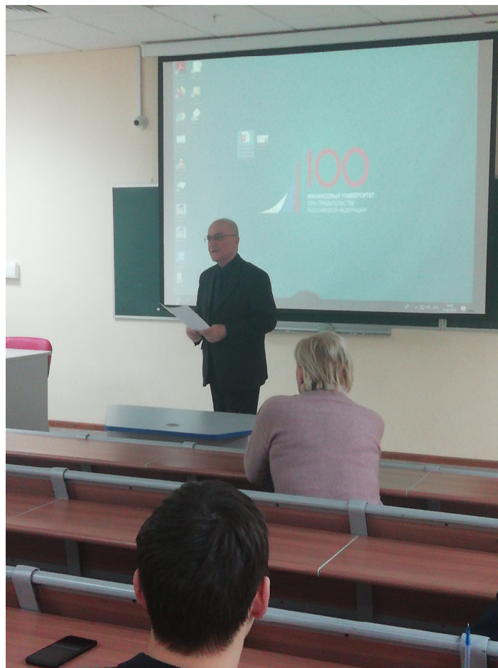
Выступление Научного руководителя Клуба по вопросу об организации и проведении V Международной научной студенческой олимпиады по истории экономических учений.