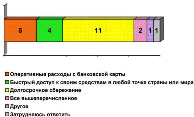
Рис. 6. Цели открытия вклада в банке 6 .

Инвестиционно-сберегательные стратегии высокодоходных групп населения/ О.А. Александрова, Н.В. Аликперова, Ю.В. Бурдастова, Ю.С. Ненахова, А.В. Ярашева / под науч. ред. О.А. Александровой, А.В. Ярашевой. – М.: Изд-во «Экон-Информ», 2016. – 158 с. ISBN 978-5-9908112-3-2