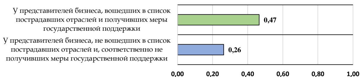
Рисунок 8. Уровень доверия бизнеса к государству в зависимости от получения мер государственной поддержки в период распространения коронавирусной инфекции, в пунктах индекса от 0 до 1

Что касается тех представителей бизнеса, которые не получили никаких мер государственной поддержки, то их уровень доверия к органам власти существенно снизился, на что указали 77% опрошенных. Однако, как отметили ряд экспертов из сферы юриспруденции, у большинства предпринимателей доверия к государству не было еще до распространения коронавирусной инфекции в России, что обуславливается постоянным состоянием неопределенности, в котором пребывает российский бизнес. Сами же меры государственной поддержки, по мнению некоторых экспертов, были недостаточно прозрачными, чтобы бизнес мог относиться к ним с доверием.