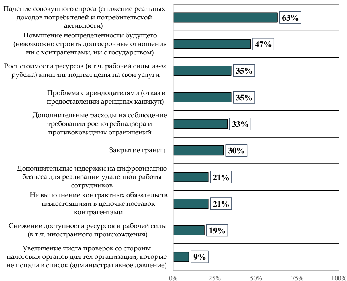
Рисунок 7. Распределение ответов на вопрос: «Что из перечисленного ниже в наибольшей степени сказалось на бизнесе в вашей сфере?», в % от опрошенных (несколько вариантов ответа)

установки к выстраиванию долгосрочных отношений как с контрагентами, так и с государством (Рисунок 7).