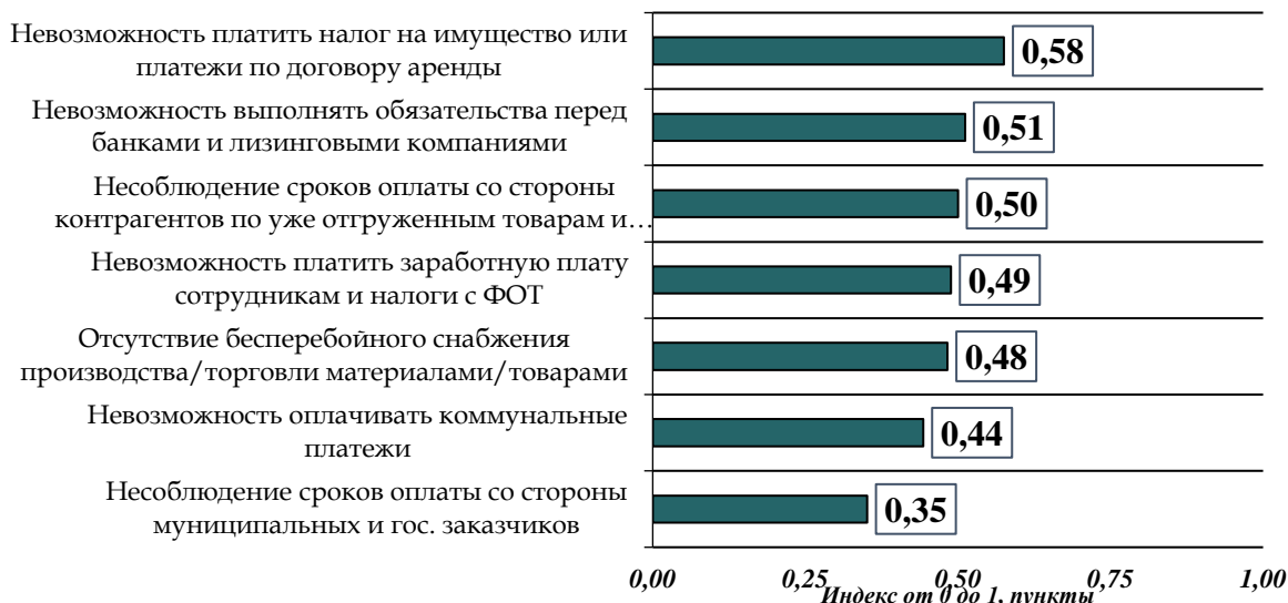
Рисунок 6. Распределение ответов на вопрос «Оцените следующие трудности, с которыми столкнулся бизнес в Вашей сфере в период пандемии», в пунктах индекса от 0 до 1 5

лизинговыми компаниями; в-третьих, четвертых и пятых – несоблюдение сроков оплаты со стороны контрагентов по уже отгруженным товарам и оказанным услугам, невозможность платить заработную плату сотрудникам и налоги с ФОТ, отсутствие бесперебойного снабжения производства / торговли материалами / товарами (Рисунок 6).