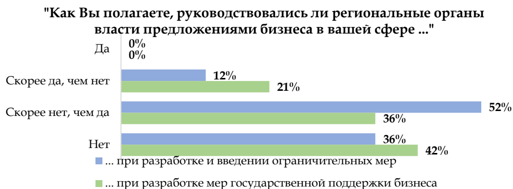
Рисунок 4. Представления бизнеса об учете их позиций при разработке и введении ограничительных мер и мер государственной поддержки региональными органами власти, в % от опрошенных представителей бизнеса