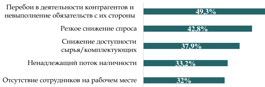
Рисунок 5. Наиболее острые проблемы, возникшие у компаний из-за пандемии Covid-19

Анализ вторичных данных также указывает на значимость данной группы факторов, куда включены такие явления, как падение спроса из-за падения доходов и экономии на «черный день» 1 ; перебои в деятельности контрагентов, снижение доступности сырья и комплектующих, сложности дистанционной организации рабочего процесса 2 (Рисунок 5).