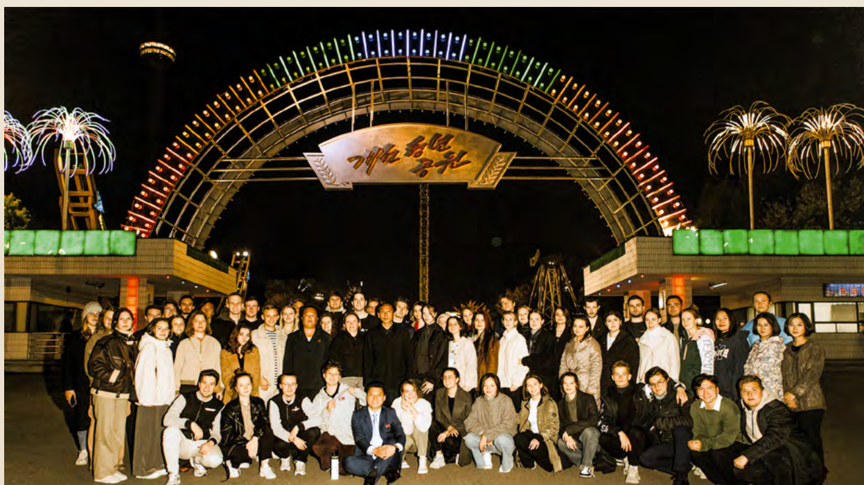
Городок аттракционов Кэсонского молодежного парка

Сам лагерь находится в пяти часах езды от Пхеньяна на берегу Японского (Корейского Восточного) моря. Территория лагеря очень большая, здесь располагаются аттракционы, лучный тир, спортивный комплекс с бассейном, большим залом и этажом для настольного тенниса, аква