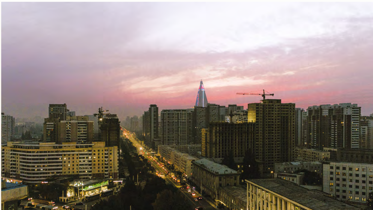
Вид с последнего этажа Триумфальных ворот

а также корейские социальные сети и мессенджеры, которые похожи на «Ватсап». Связаться с кем-то за пределами Северной Кореи гражданам страны можно, но крайне сложно, данная возможность выпадает крайне редко и то только по электронной почте.