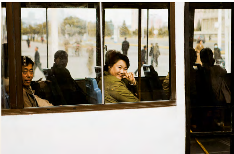
Общественный транспорт в Пхеньяне