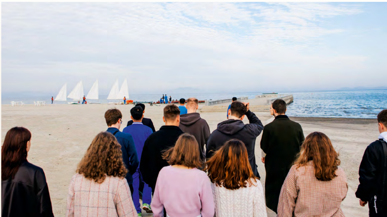
Детский лагерь «Сондовон»