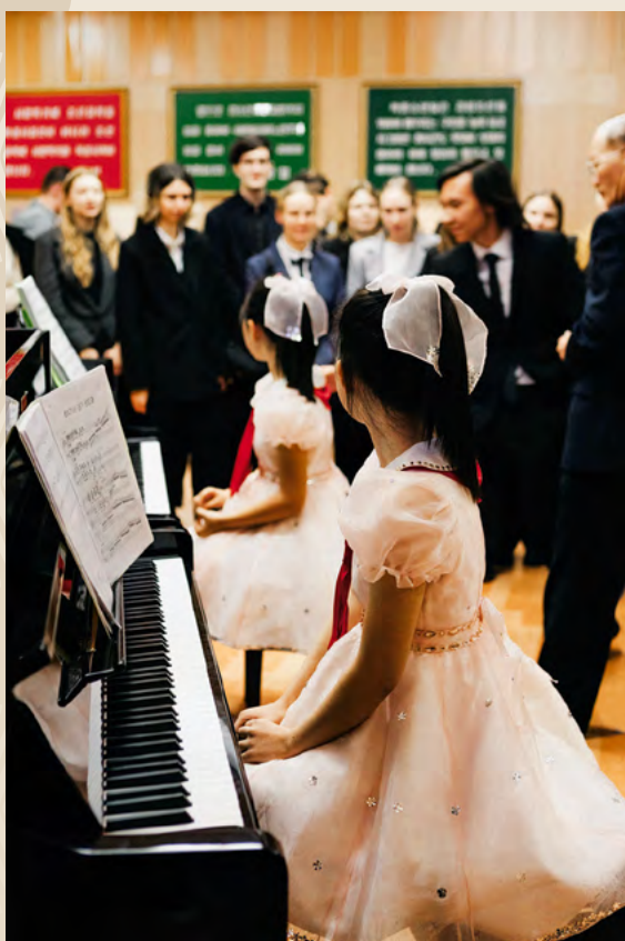
Мангедэнский дворец школьников