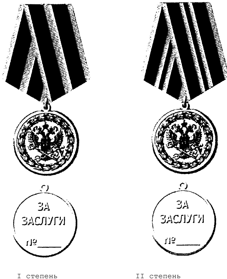
РИСУНОК МЕДАЛИ ФЕДЕРАЛЬНОЙ НАЛОГОВОЙ СЛУЖБЫ "ЗА ЗАСЛУГИ"