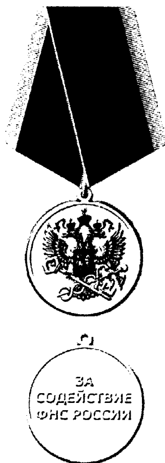
РИСУНОК МЕДАЛИ ФЕДЕРАЛЬНОЙ НАЛОГОВОЙ СЛУЖБЫ "ЗА СОДЕЙСТВИЕ ФНС РОССИИ"

Приложение N 3 к Положению о медали Федеральной налоговой службы "За содействие ФНС России"