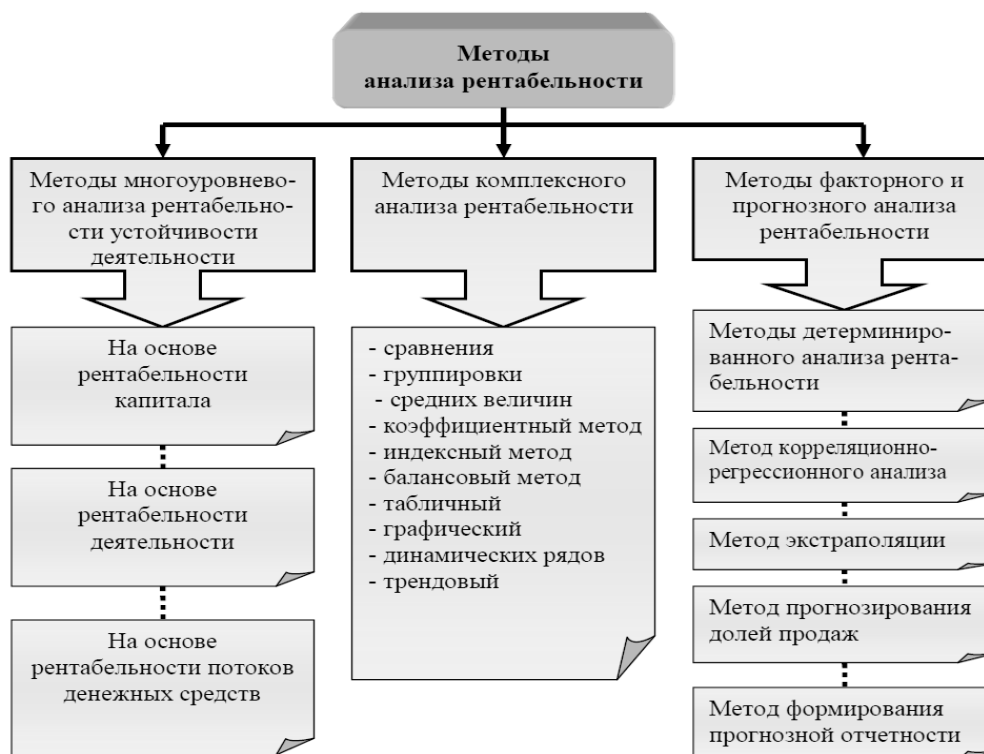
Рисунок 1. Основные методы анализа рентабельности организации

Графики, схемы, диаграммы, рисунки располагаются в курсовой работе (работе) непосредственно после текста, в котором они упоминаются впервые, или на следующей странице. Иллюстрации следует нумеровать арабскими цифрами сквозной нумерацией (то есть по всему тексту) – 1,2,3, и т.д., либо внутри каждой главы – 1.1,1.2, и т.д.