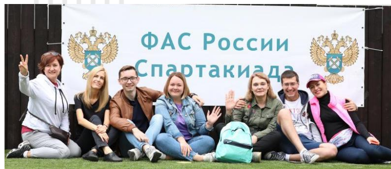
Спортивные соревнования и спартакиады