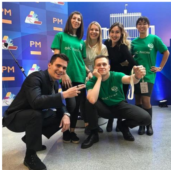
Участие в Молодежном Совете