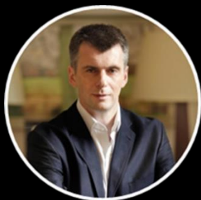
Российский предприниматель, политик М.Д. Прохоров