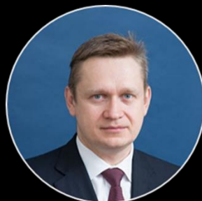
Председатель Правления, Генеральный директор АО «МХК ЕвроХим» В.В. Рашевский