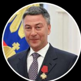
Председатель Правления АО «Газпромбанк» А.И. Акимов