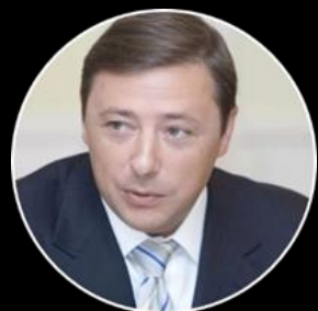
Заместитель Председателя Правительства РФ (2010-2018 г.г.) А.Г. Хлопонин