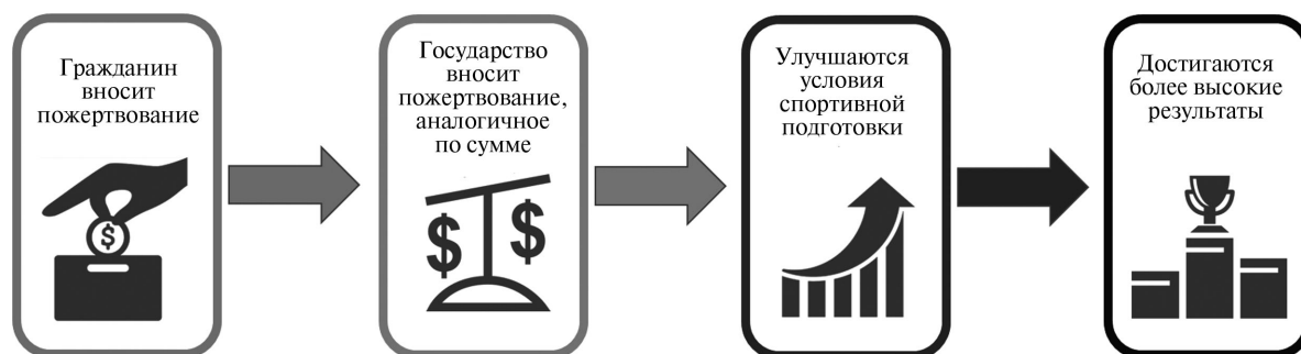
Рис. 1. Схема поддержки спорта высших достижений через гранты One Team Singapore

В Австралии фонд поддержки спортсменов выделяет 12 млн австр. долл. в год для спортсменов, участвующих в Олимпийских и Паралимпийских играх и иных турнирах. Это более 650 спортсменов, участвующих в 30 видах соревнований ежегодно.